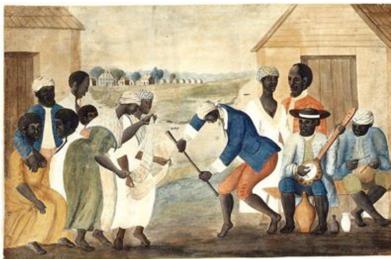
The Old Plantation , pintura de finais do século XVIII. Escravos bailando ó son dun banjo e percusión.

Xentes de diferentes nacións de África, Europa e Latinoamérica contribuíron ó rico patrimonio musical de New Orleans. Na era colonial de Francia e España, os escravos tiñan máis liberdade de expresión cultural que os das colonias inglesas que despois se converterían nos Estados Unidos. Nas colonias protestantes, a música africana era vista como "pagana" e era comúnmente suprimida, mentras que en Louisiana era aceptada. Ademais da poboación escrava, New Orleans tamén tiña a maior comunidade de xente negra libre en Norteamérica.